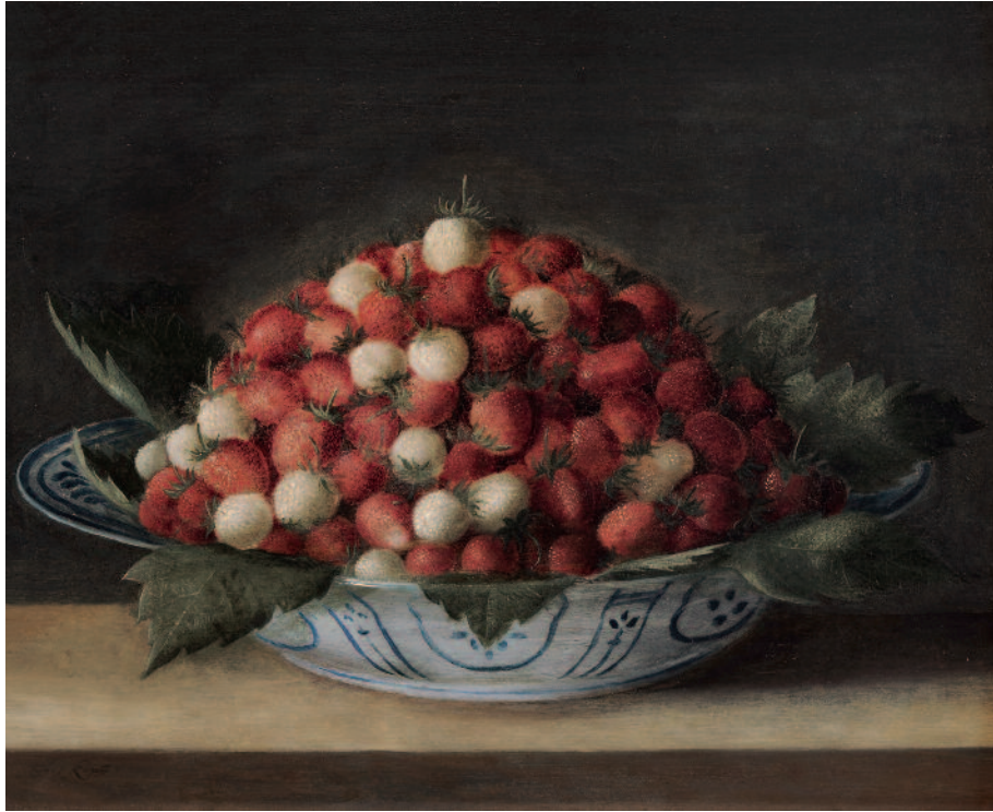
Une jatte de fraises (vers 1620).