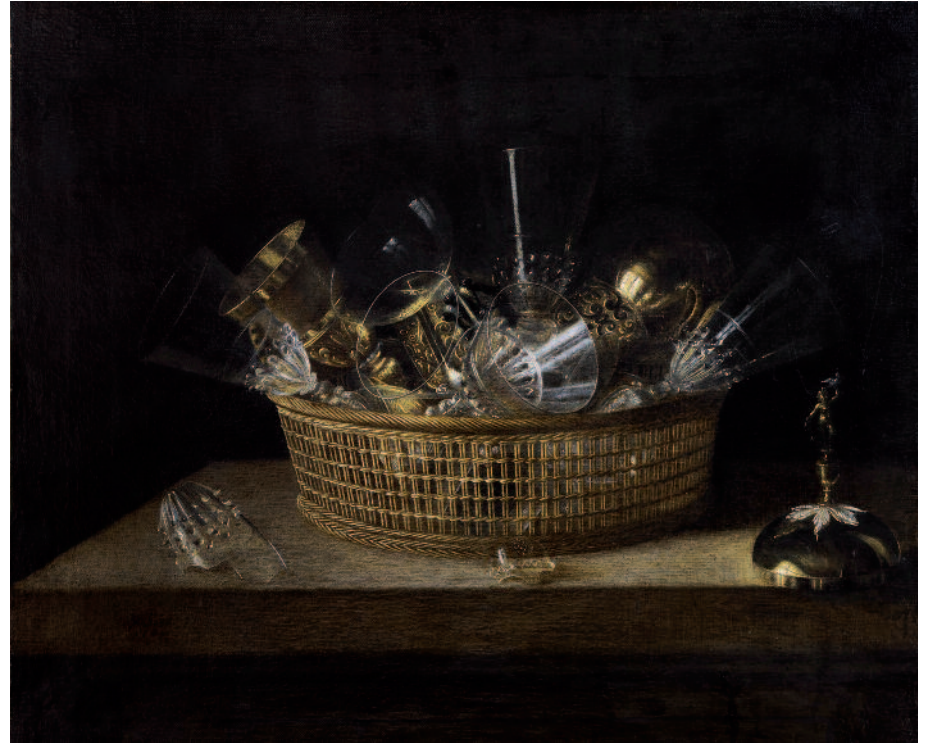
Corbeille de verres (1644).