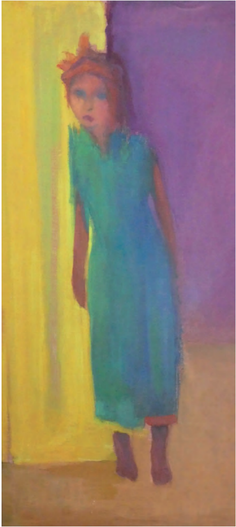
Femme en vert , Huile sur toile, 53 x 61 cm, 1972.