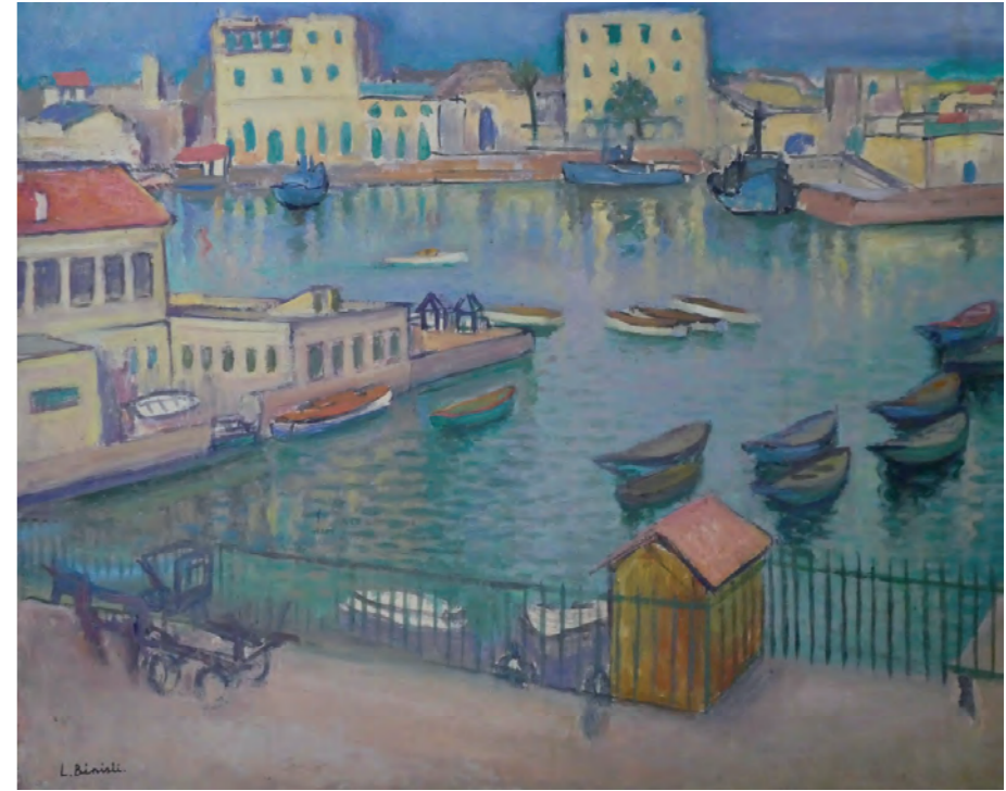
La darse [d'Alger] , Huile sur panneau, 74 x 55 cm, 1955.