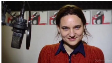
Vidéo dans l'article.

ARTICLE PUBLIÉ LE MARDI 24 DÉCEMBRE 2013